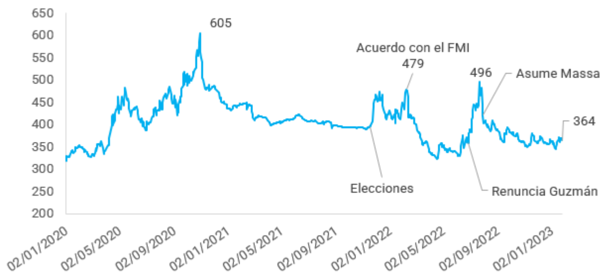
Gráfico 1. Cotización histórica del dólar CCL a precios actuales

En tres momentos de alta tensión macroeconómica, el dólar financiero hizo picos que todavía están lejos de los niveles actuales (ver Gráfico 1). Por eso, con distintas estrategias, el gobierno ha intentado incidir en el precio de los dólares paralelos evitando una escalada.